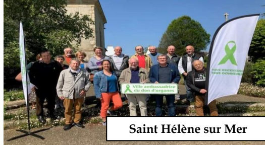
Saint Héléne sur Mer