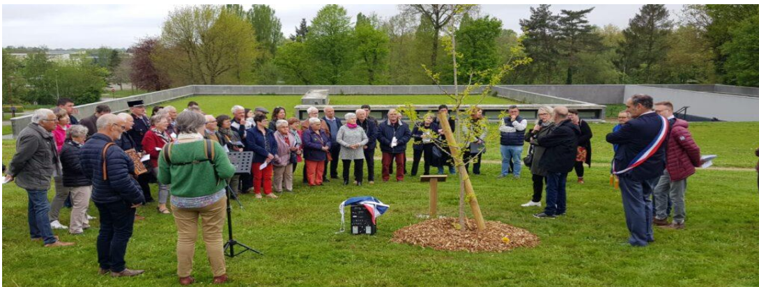
Montauban arbre de vie Hommage aux donateurs

Amigo-Bretagne avec Transhépate Bretagne et France Rein Bretagne ont sollicité plusieurs communes du 35, Langan a signé la charte VADO (Ville Ambassadrice du Don d'organes), en attente de réponse de Gévezé et Saint Gilles