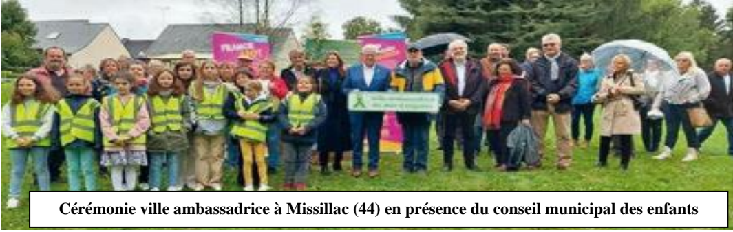
Cérémonie ville ambassadrice à Missillac (44) en présence du conseil municipal des enfants