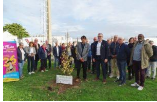
Saint Pol de Léon