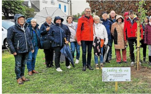
Camaret sur Mer