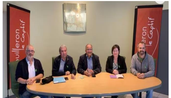
Mouilleron Le Captif signature de la charte Ville Ambassadrice

Durant cette année 2024, de nouvelles chartes doivent être signées, des arbres de vie plantés et des panneaux posés, tout cela pour informer la population bretonne sur le Don d'Organes.